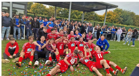
La joie des joueurs à la fin du match