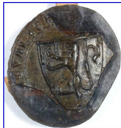
Sceau de Buridan

C'est ce blason-là que reprend la commune de Daours sur ses documents officiels