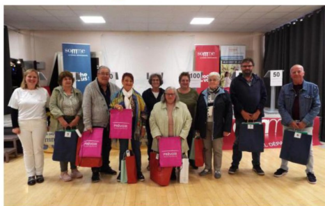
DAOURS Champions pour le pays de Somme : un troisième titre consécutif ?

Avec 2 victoires consécutives en 2022 et 2023, l'équipe de Daours, détentrice de la coupe départementale du jeu « Champions pour le Pays de Somme » ne pouvait défendre sa couronne. En effet, le règlement du jeu ne leur permettait pas de rejouer ce samedi 28 septembre dernier.